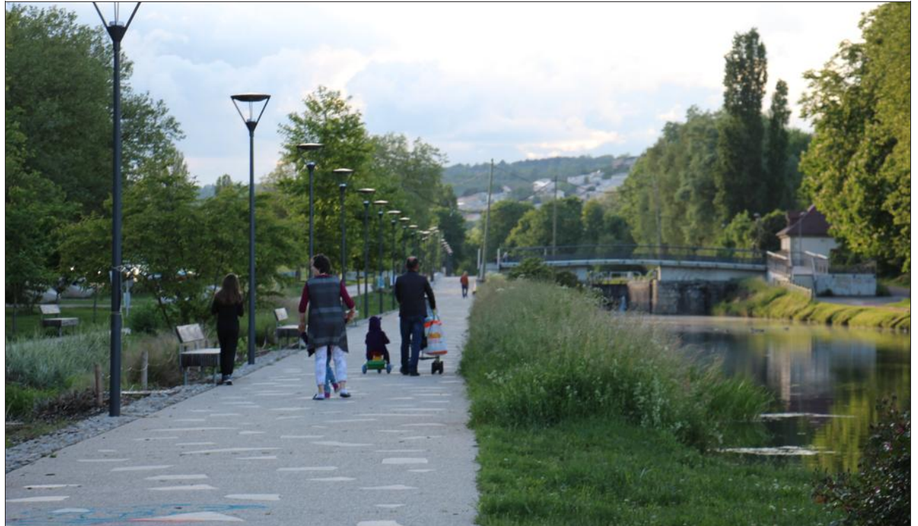
■ Les habitants sont nombreux à venir se promener sur les berges depuis leur réfection.

Après plusieurs années de concertations avec la population locale, la Splaad (Société publique locale d'aménagement de l'agglomération dijonnaise) démarrait son chantier de réaménagement de la ZAC Quai des Carrières-Blanches, en août 2013. Deux ans plus tard, la promenade changeait d'aspect. La construction d'une passerelle a même permis de relier le lac Kir à la Fontaine d'Ouche. Le chantier n'est pourtant pas terminé. Désormais, le projet passe à l'étape de commercialisation. Un premier programme immobilier inaugurera, prochainement, ce qui va devenir un écoquartier de 350 logements.