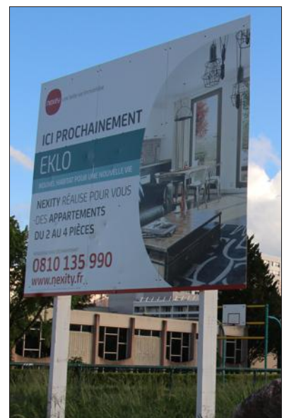
■ La ZAC quai des Carrières-Blanches.