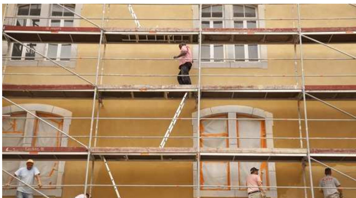
Travaux de rénovation au lycée Pasteur, à Besançon